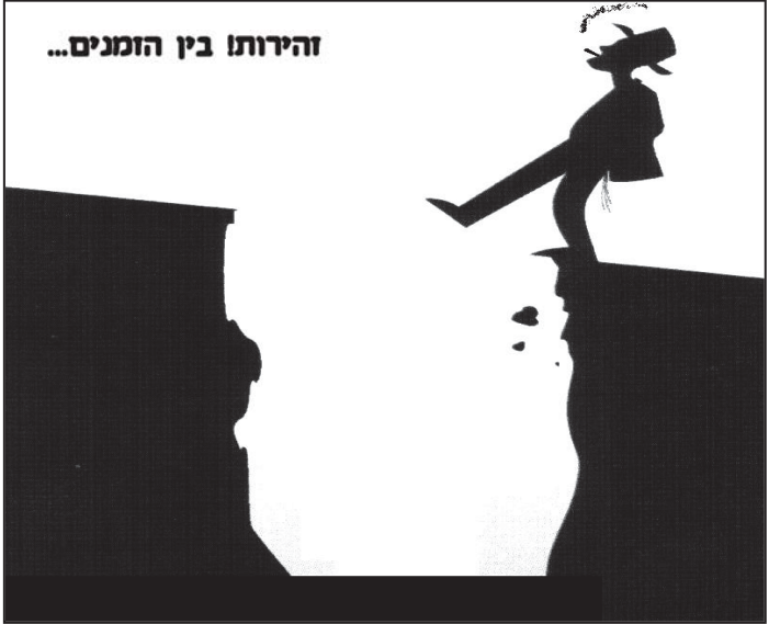
זהירותו בין הזמנים...