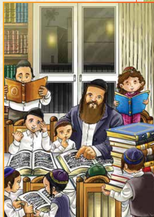
מתוך סדרת הספרים "ספורי צדיקים על מדות ומע"ט" "ושננתם לבניך"

עיניו של הילד ברקו: "הלא לימדנו אבינו שהקב"ה קדש את עמו ישראל בהר סיני ע"י חפה וקדושין. על פן מטל עלינו ללמוד את המסכתות העוסקות בנושאים הללו..."