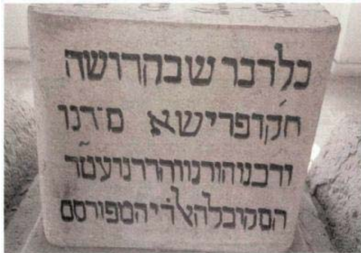
מצבת קבורת רבי חיים ויטאל בדמשק - צד 2

"לא רציתי להשתמש בשמות הקדש לכן לא פתחתי". אמר לו האריז"ל: "אלו לא נשתמשת בשם לבא לדמשק החרשתי, אבל מאחר שנשתמשת כבר היית יכול להשתמש לפתחו והיה קדוש השם ותקון גדול". אמר לו מורנו רבי חיים ויטאל: "אם כן אחזר לירושלים לפתחו". אמר לו: "חלפה שעת הרצון ועבר זמנו".