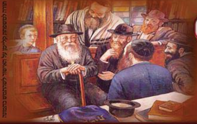
תודה למספרות קליטן על האשיר לשריתמש בתמונה