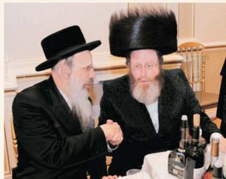
כ"ק האדמו"ר מליזענסק שליט"א

כל השנה כולה מגיר המלמד זעתו אצל בני הכפרי - להוציא את ימי החגים. לפסח ולתשרי קורא הכפרי דרור למלמד ומשלחו לביתו בצרוף דמי מלמדות. נקל לשער כי אין בכח של משכורת זעומה זו כדי לכלכל את בני ביתו בעושר ובכבוד. מסיבה זו נאלצת אשתו לסייע בבישול בבתי נגידים, ומן התמורה מכלכלת היא את בני ביתה בלחם צר ומים