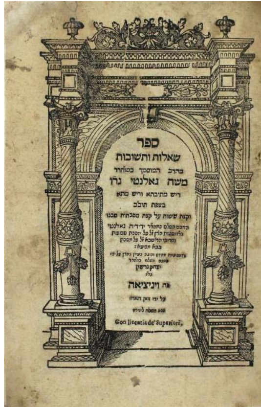
ספר שאלות ותשובות מהרב המוסמך כמוהר"ר משה גאלנטי נר"ו, ריש מתיבתא וריש מתא בצפת תוב"ב.