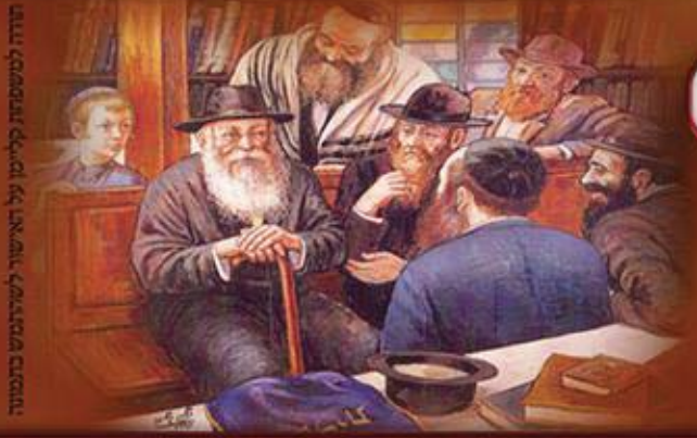
תודה למשפחת קליין על אישור לשריטמש בתמונה