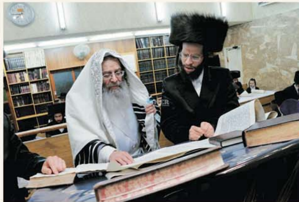
קריאת מגילה בקומרנה

נס מרכזי נוסף שהתגלה מאוחר יותר היה, שלמרות שלסאדם חוסיין היתה היכולת לשגר גם טילים נושאי ראשי נפץ כימיים, וגם היה ברשותו תותח על – ארוך טווח, הוא לא השתמש בהם. איש אינו יודע להסביר על פי שכל, מדוע הוא לא השתמש בכלי נשק אלה, וכאמור חייבים רק לומר – שהיה זה נס גלוי! בנוסף לניסים המרכזיים הללו, החלו להתרחש ניסים פרטיים רבים שהיו בבחינת נס בתוך נס. ולהלן כמה דוגמאות לכך: