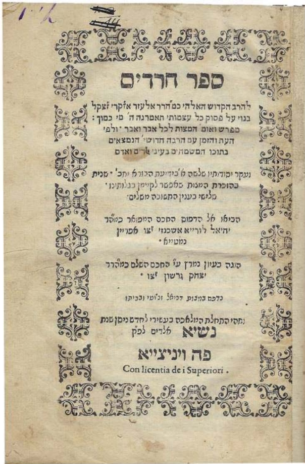
ספר 'חרדים' דפוס ראשון

שאל אותו הסולטאן מתי יצאת משם, ענה בעל החרדים היום בבקר יצאתי והיום באתי. הדבר היה לפלא בעיני הסולטאן, האיך יתכן דבר כזה להגיע ביום אחד מארץ ישראל לתורכיה, והוא שלח