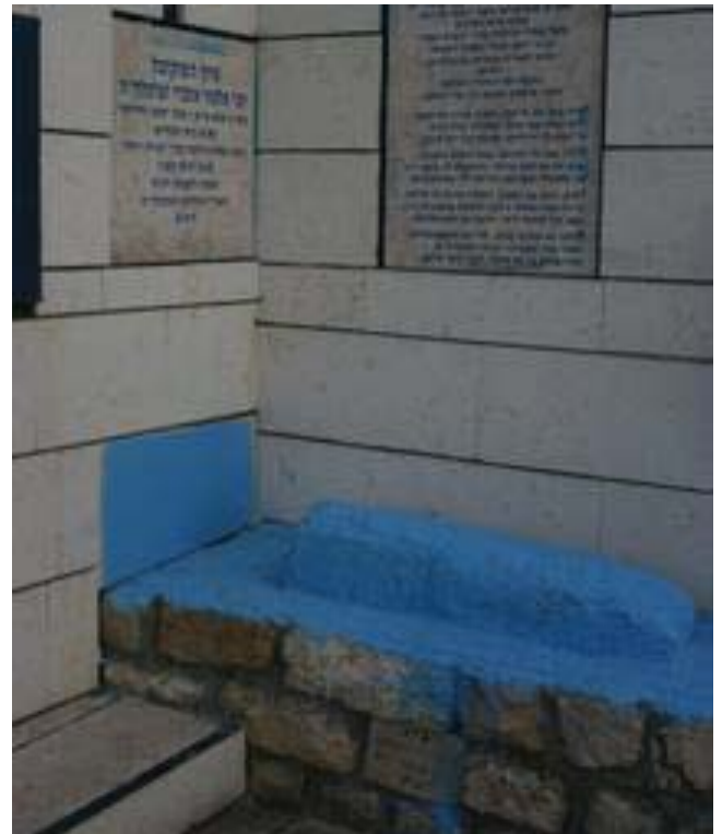
מקום קברו של בעל ה'חרדים' לפי ההשערה

בשנת שמ"ח יסד רבנו אלעזר אזכרי חבורה קדושה שנקראה 'ספת שלום'. רבנו מספר מה גביאו ליסד חבורה זו, שזה התחיל בהתעוררות תשובה שהיה להם בציון רשב"י במרון, כפי שכותב בהקדמתו לספר חרדים: "בהיות חברים מקשיבים אל ציון הרשב"י, עוסקין באמרותיו אמרות טהורות כדרבנו פעמים בשנה מעת לעת ומפקידה לפקידה, שם ישבנו גם בכינו צעקנו במרירות לבנו ויתכו כמים שאגותנו, בראותנו איד רבי שמעון בר יוחאי וחבריו בדורותם היו מצטערים ואוננים ובוכים כל יום על גלות השכינה וכבוד ה' הגדול המחלל בגוים על רוב פשעינו, ואותם הצדיקים לא היו גרמא בגזיקין, וקל וחמר לנו, שאנחנו הגורמים, שיש לנו לבכות ולהצטער בפלים".