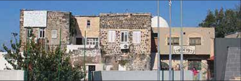
בית כנסת עץ חיים בטבריה

לאחר פטירתו מלא את מקומו ברבנות העיר בנו רבי יצחק אבולעפיה.