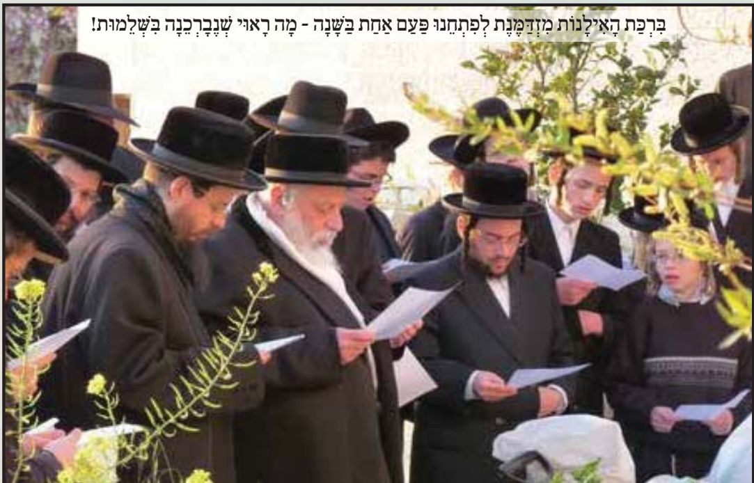
בברכת האילנות מזדמנת לפתחנו פעם אחת בשנה - מה ראוי שנברכנה בשלמות!