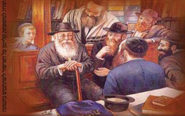
תורה למשפחה קליטון על ואישור לשריגוש בתמונה