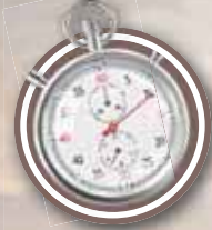
(ש"ע או"ח קכד ח)

'אמן יתומה' שעונה מבלי לשמע את הברכה או שמשפתה ואינו עונה מיד עם סיום הברכה.