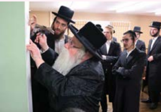
בערי וועבער הי"ו, סיום מסכת ברכות נעשה ע"י הבה"ח שמי הישיבה. עון ווייס הי"ו מחשובי תלמידי הישיבה.