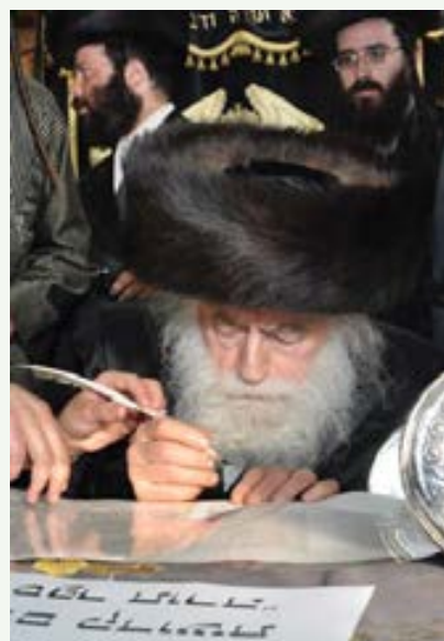
עזיבתו ביום שני כ"ב סיוון תשע"ח, אז נסע הגאב"ד ממקום רבנותו וקבע את מקומו בעיר בית שמש.

בחדש מרחשון תשמ"ח הגיע הגאב"ד זצ"ל למעלבורן לראשונה, ובח' תמוז של אותה שנה שב לכהן כרב ואב"ד, והחלה פרשת רבנות לת' פארת. זכתה העיר מעלבורן להיות אכסניה לכ"ק מרן גאב"ד זצ"ל למשך שלוש שנה וקשה היתה