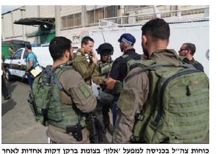
כוחות צה"ל בכניסה למפעל 'אלון' בצומת ברקן דקות אחדות לאחר הפיגוע

הצמרת הבטחונית משוכנעת: "אנחנו נגיע אל המחבל ונמצא אותו" ■ צה"ל נערך להטלת עונשים על בני משפחת המחבל - ביתו נמדד אתמול לקראת הריסתו והותו וכוחות הבטחון נמצאים במצוד חסר תקדים עליו, בא אתמול בבוקר למפעל 'אלון' למחזור חומרים, בצומת ברקן שם עבד כשבעת החרושים האחרונים, ואחרי 10 דקות של עבודה, שלף מחיקו רובה 'קלר' ורצח באמצעותו 2 יהודים שעבדו אתו ופצע באופן קשה עובדת שלישית. החוצה מן המפעל כשהוא עובר במהירות ליד עובדים ערביים רבים המביטים בו ונס מן המקום ככל הנראה לעבר כלי רכב כלשהו שבאמצעותו הצליח להימלט ולמצוא מחסה במקום שעדיין לא ידוע היכן הוא.