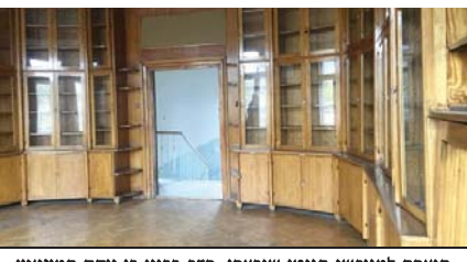
הנצחה למוגושי הגיטו שנרצחו. חדר בבנין בו יוקם המוזיאון

המוזיאון יוקם בבנין ששימש בעבר כבית חולים לילדים בגיטו