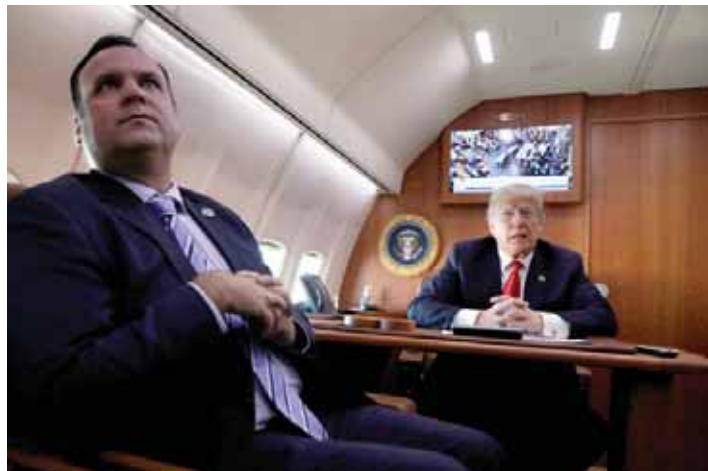
טראמפ צופה בהצבעה בסנאט ממטוסו, לצד יועצו לענייני תקשורת, דן סקאבינו

■ בתום סאגה ממושכת במהלכה הואשם במעשי שחיתות ■ הדמוקרטים, שניסו לדחות את ההצבעה עד לאחר בחירות האמצע כדי לסכל את המינוי: חקירת ה-FBI לא הייתה ממצה ■