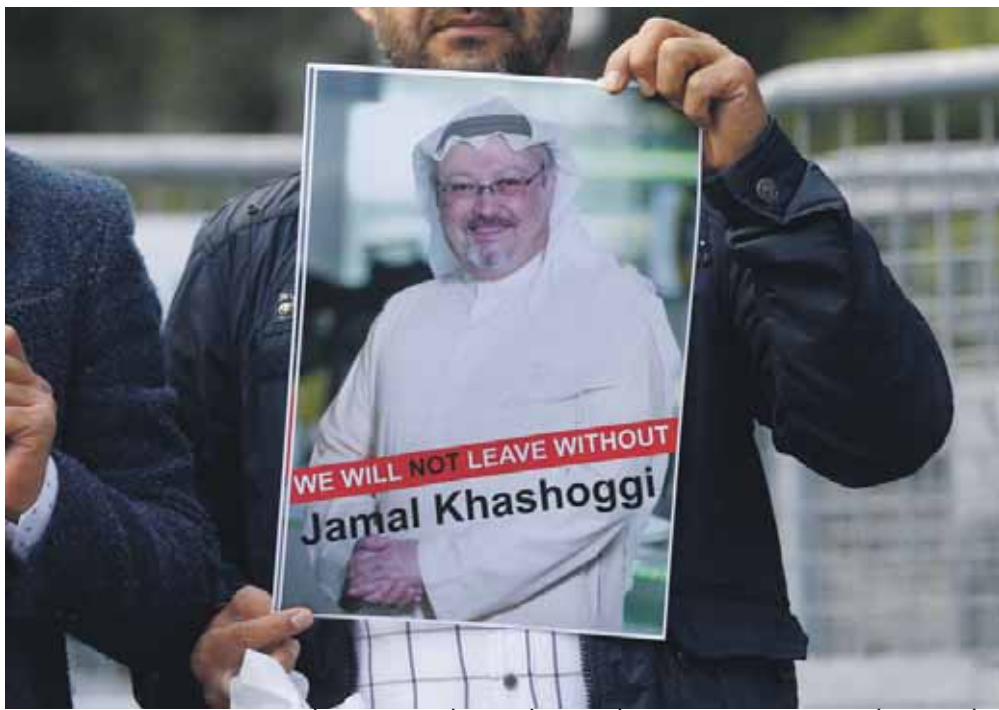
“לא נעזוב בלי חאשוג’י”: הפגנת מחאה של ידיו מול הקונסוליה שבתוכה נעלם

■ ארדואן: אין משבר כלכלי במדינה, הוריתי לשרים לא לקבל ייעוץ מחברה אמריקנית