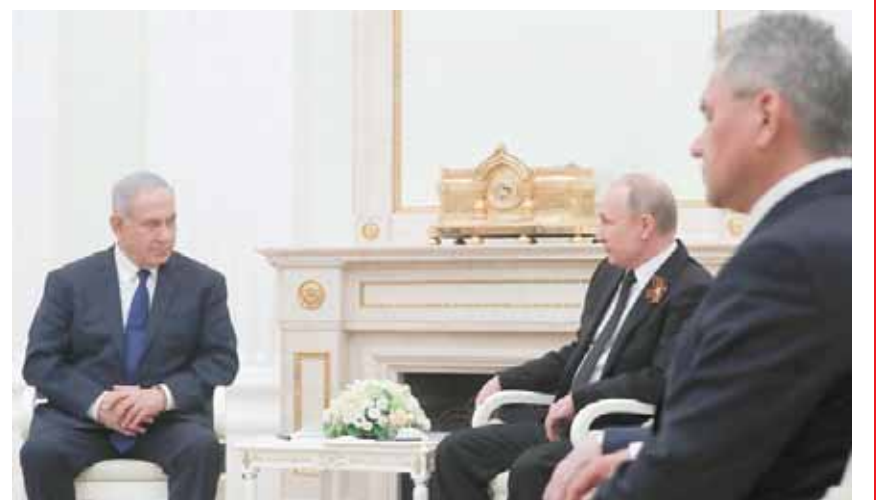
נתניהו ופוטין. הפגישה הבאה ביניהם צפויה להיות מתוחה במיוחד

■ המנהיגים ידונו במתיחות הדיפלומטית שנוצרה בעקבות הפלת המטוס הרוסי והשינויים בשטח בעקבות העברת הטיילים המסוכנים לידי אסד ■