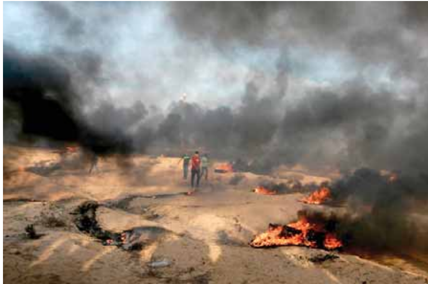
העימותים בגבול הרצועה גוברים על רקע כישלון מאמצי ההסדרה.

על פי גורם ביטחוני בכיר במצרים, המשלחות של פת"ח וחמאס שהגיעו לקהיר עזבו לאחר זמן קצר לאחר שלא הצליחו להגיע להסכמות. על פי הפרטים שנחשפו ב"ישראל היום", זו הסיבה ללחץ של חמאס בגדר הגבול. הבכיר המצרי הדגיש כי "אם מצרים תפסיק את מעורב-ותה במגעים, יש סבירות גבוהה שיפרוץ