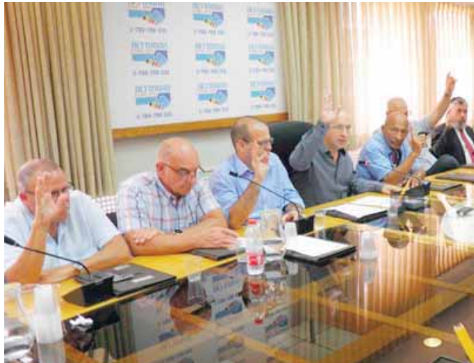
הצבעת הנהגת ההסתדרות על סכסוך עבודה כללי במשק.

יו"ר ההסתדרות אבי ניסנקורן אמר בשיבת הנהגת ההסתדרות, כי "ההיגיון ותפיסת כבוד האדם שלנו כחברה לא עומדים בקנה אחד עם העובדה שבמדינת ישראל חיי העובדים נתפסים כחסרי ערך ונתקלים בחומה של אדישות. המספרים בלתי נתפסים, עוד ועוד עובדים נופלים למותם בהרג שאפשר למנוע בקלות, אך לצערי המדינה ממשיכה להתנהל כאילו לא אכפת לה מהנושא. עד כה, למרות ההתרעות החוזרות, לא נעשה צעד משמעותי לצמצום נגע הפגיעות בעבודה, ולכן אנו מכריזים על סכסוך עבודה כללי בכל המשק. זוהי חובתנו המוסרית והערכית כחברה להילחם נגד התופעה".