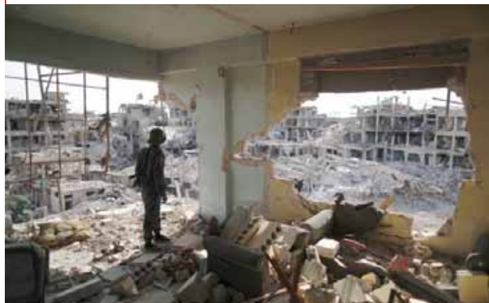
בימים אלה, עמלים הסורים לפנות טונות של הריסות ממחנה הפליטים הפלשתינים לשעבר יארמוק, שחרב במלחמה

■ הרוגים בפיגוע בעיר הנשלטת ע"י המורדים בגבול טורקיה ■