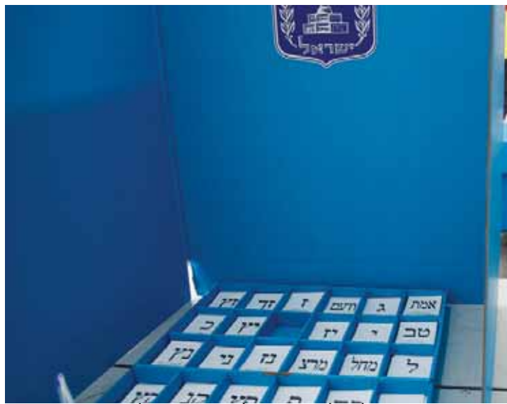
האם הבחירות יוקדמו לתחילת 2019?

■ לדבריו, אם יושג פתרון מוסכם למתווה חוק שיהיה מקובל על כולם, הרי שאין סיבה ללכת לבחירות ובמקרה כזה יושג הסדר גם על חוק הגירור