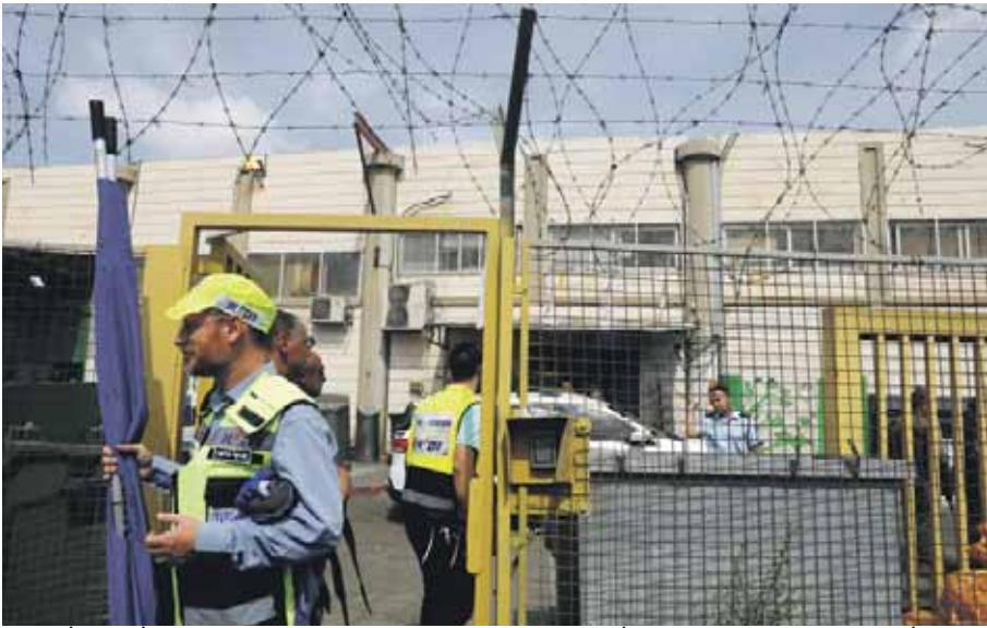
המפעל בברקן מעסיק כ-250 עובדים פלשתינים. "חשבותי שהפרנסה מונעת טרור", סיפר מנהל המפעל בכאב

מצוד אחר הפלשתיני שרצח שני יהודים הי"ד ופצע אשה באורח קשה בלב אזור התעשייה