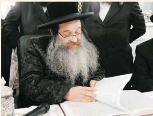
כ"ק האדמו"ר מנדבורנא שליט"א ליד הציון הקדוש במוז'בו

"דע לך כי אני הוא האיש, אותו הנך מבקש" – אמר לו הבעש"ט – "וכעבור זמן מה תשכיל לדעת סיבת בואנו אליך".