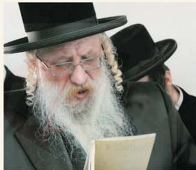
כ"ק אדמו"ר צ'רנוביל אשדוד שליט"א