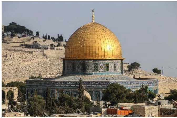
'כיפת הסלע' שבתוכו נמצאת אבן השתיה לפי דברי רבנו מאחרוריו נמצאת הר הזיתים

עוד אמרו העכו"ם, שיש תחת הכפה מערה, ושהמלכים הראשונים רצו לדעת מה היה שם, ושלשלו בני אדם בתוכה ומתו, וסגרו אותה ומלאוה עפר, עד היום הזה אין אדם יודע מה יש שם. וקרוב אצלי, שנאמר להם או שמעו שהארון גנוז שמה ולפיכך היו חופרים (אלו) [אולי] ימצאו אותו, ולכן השפל קרקעית הבית ונתגלה אבן השתיה..."