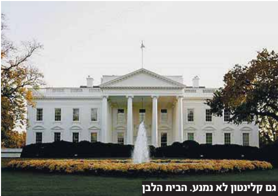
גם קלינטון לא נמנע. הבית הלבן

המוסלמי האנטישמי, שני בחר לתבוע הכללי של מדינת מינסוטה. דרשוביץ ציין שאפילו הנשיא לשעבר ביל קלינטון לא נמנע מלי