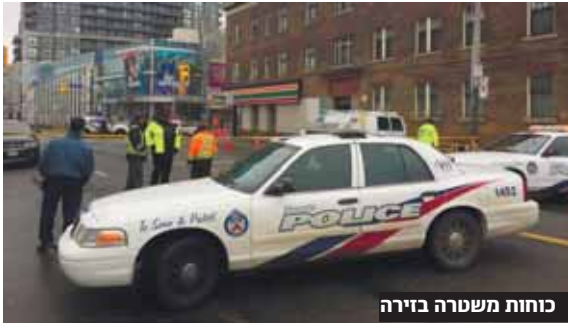
כוחות משטרה ביהיה