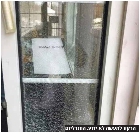
הרקע למעשה לא ידוע. הונדליזם

בית חב"ד הפעיל ושוקק החיים בעיר פיבודי, ספג נזקים לאחר שאלמוני ירה לעבר פתח הבית. על פי ההשערות, אין מדובר בירי מנשק חם, אלא בכדורי קרמיקה שנורו מאקדח אוויר.