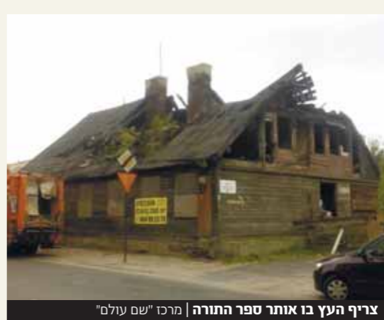
צירף העץ בו אותר ספר התורה | מרכז 'שם עולם'

ככל הנראה תשמישי קדושה נוספים בעל ערך היסטורי רב כמו סידורי תפילה מוזות ותפילין וחפצים אישיים של יהודים שנרצחו במלחמה, נמצאו במהלך העבודות אך הושלכו לאשפה ■ ספר התורה הועבר לידי מכון 'שם עולם'