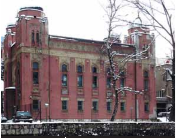
בית הכנסת בסרייבו - הייחוד שעודו פעיל בבוסניה

השפה היהודית הספרדית הופכת השראה ברחבי סרביה ולאחרונה מתפרסמים מיזמים שונים וחדשים לשמירת השפה והמורשת