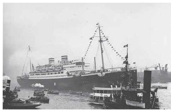
מאת א. למל

"כאשר קנדה שללה מתן מקלט מדיני ל-907 היהודים הגרמנים שהיו על סיפונה של סנט לואיס, לא רק חטאנו לאותם נוסעים, אלא גם לצאצאיהם ולקהילתם", הצהיר ראש ממשלת קנדה