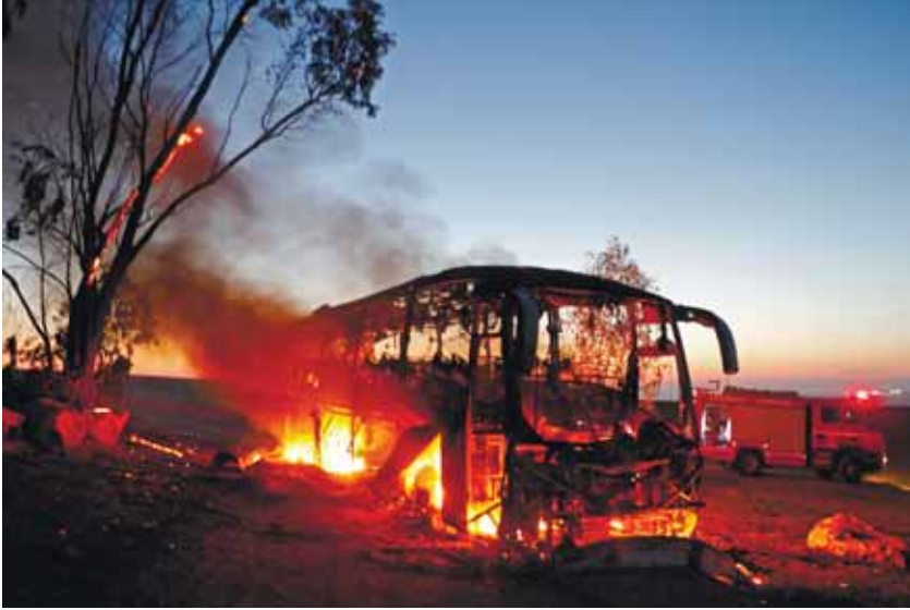
מאת כתב 'המבשר'

על שחיה. אתמול אירע נס גדול שגם החמאס שאינו חשוד בהפג' ניסו כי לעולם חסרו. הבה נתפלל לקב"ה שרנאה ניסים גלויים כפי שאנאמר ה' צבקות עמנו משגב לנו אלוהי יעקב סלה ה' הושיעה המלך יעננו ביום קראנו".