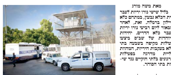
כלא גבעון

מאת משה מורג בית כלא גבעון, במחנה 2000, נרדף על ידי ירי מרובה. שלושה תושבי ג'לג'וליה נעצרו בשל חשד בהגנה על בית הלאומי.