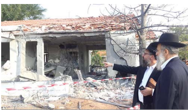
משלחת צעירי חב"ד ליד הבית ההרוס באשקלון, אתמול

משלחת צעירי חב"ד ביקרו אצל תושבי הדרום המופגז