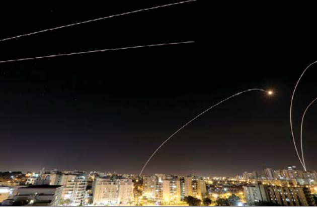
מערבת כופת ברזל בשימי אשקלון אתמול למנות בוקר