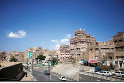
העיר העתיקה צעא

מאת סופר "המודיע" הערכה בצנצנא, בירת ת-ימן, מציינת שבנרד שמונים המישה אלף איים בגילאים שנות חמיש שנים מתו עד כה מרעב ומחלות מאז פרצה מלחמת האזרחים בתימן ב-2015. המספרים הנתונים המזעריים מבוססים על תיעוד הממותה של ילדים שמתו אספקה ותורפות.