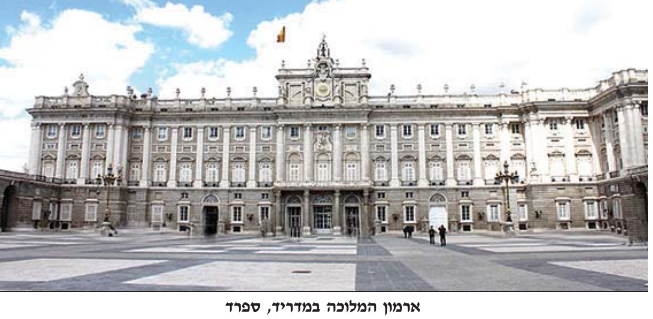
ארמון המלכה במדריד, ספרד

מאת סופר "המודיע" למעלה מ-10,000 יהודים הנמנים על האצאיות של מוגרשי ספרד, קיבלו אזרחות ספרדית או פורטוגלית ב- תאם לחוק שנחקק לפני שלוש שנים. אלפים נוספים מצויים בהליכים האזרחות. כך עפ"י נתוני משרד הפנים הספרדי שפורסמו בסוף הש- בוע האחרון. הזכות הוענקו לאלה שהצליחו להוכיח "קשר מסור- תי" ליהודים ספרדיים או פור- טוגזיים, כמו "שמות משפחה, עקב תהליך הברקזיט.