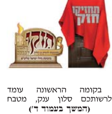
בוקמה הראשונה עומד לרשותכם סלון ענק, מטבח (המשך בעמוד ד')

עוד בקטלוג: הסופר משה גוטמן בסיפור מרגש במיוחד. ואתגר מהנה נושא פרסים