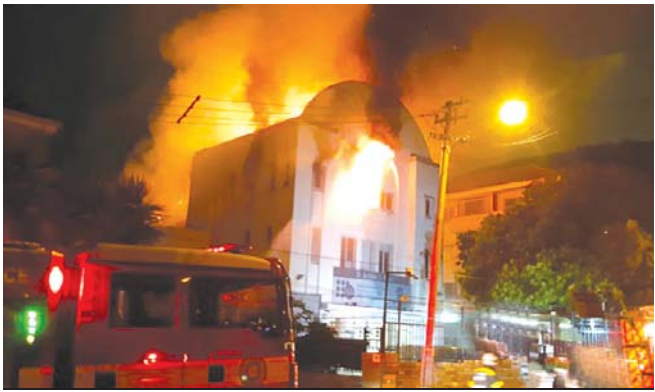
המחזה המבעית. בית הכנסת 'מורשה' עולה באש

משטרת דרום אפריקה מעריכה: האש פרצה כתוצאה מנרות חנוכה שהודלקו בבית הכנסת