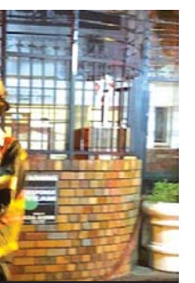
כבאי מחלץ את ספרי הקודש

למרב הנס, לא היו נפגעים בנפש, אולם כאמור, נזק כבד נגרם לבית הכנסת, ושבעה ספרי תורה נשרפו בלהבות הענק, עשרות ספרים וטליתות הוצאו מבית הכנסת לאחר שניזוקו, את הטליתות תלו מתפללי בית הכנסת על מתניי ייבוש, לאחר שנרטבו ממים.