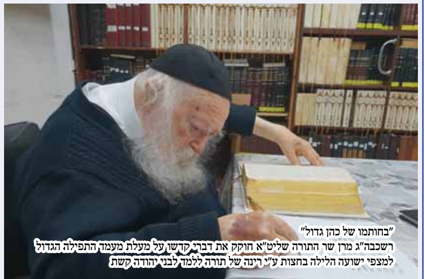
"בחזותו של כהן גדול" רשכבה"ג מרן שר התורה שליט"א חוקק את דברי קדשו על מעלת מעמד התפילה הגדול למצפי ישועה הלילה בחצות ע"י רינה של תורה ללמד לבני יהודה קשת

שמות להזכרה במעמד הקדוש שכבר הושיע רבים בס"ד ניתן עדיין למסור בטלפון 0722-600-200.