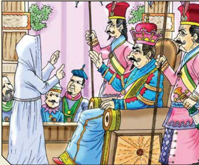
© מתוך: "הפרשה מספרת לי" בראשית