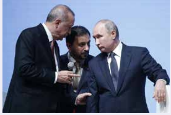
אתמול דיווח ה"ניו יורק טיימס" כי הכורדים פנו אל משטר אסד וביקשו ממנו לסייע להם מול הטורקים, בגלל "הברגדות של ממשל טראמפ", כדי בריהם.

הכורדים פנו לאסד בבקשה כי יסייע להם מול הטורקים • המהלך הכורדי מגיע בעקבות החשש מפלישה צבאית טורקית