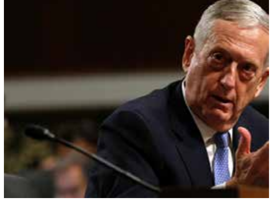
המטוסים. אולם, ארה"ב התנגדה למהלך ההשבה וסירבה לאפשר מכירת מטוסים אמריקניים באמצעות השבתם על ידי מדינה אחרת. בעקבות כך בוטלה העסקה.

מזכיר ההגנה האמריקני לשעבר סירב לאפשר לישראל את שדרוג מטוסי אף-16 כחלק מהעסקה עם קרואטיה