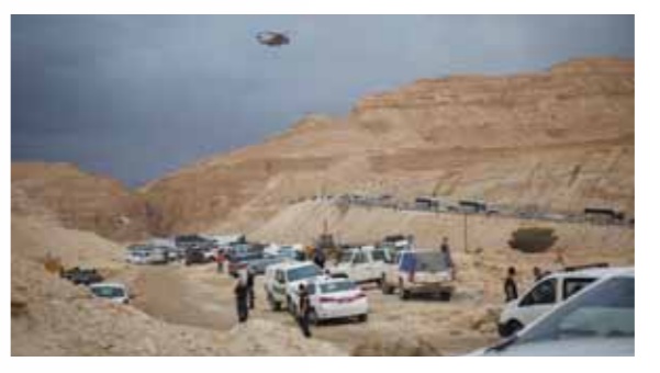
מאת חיים מרגליות

כתוצאה מפגיעת השטפון, מצאו את מותם עשרה תלמידים