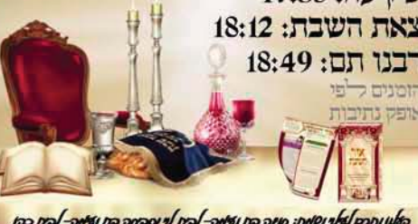
מלון נתיבות לילי נשיות: מונח בת נשיות - לוח לוי וסמחה בת נשיות - לוח כהן

העלון מודפס על נייר המורכב מללא חשש הדלדול שבת