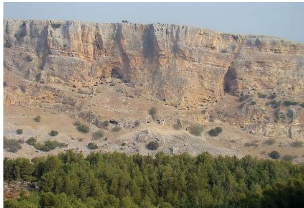
הצוקים שליד עכברא שם לפי המסורה נטמנו חלק מאוצרות בית המקדש

'מסכת כלים של בית המקדש' היא ברייתא קדומה שנדפסה בהקדמת ספר 'עמק המלך' (פרק יא) 5 , וכן הוא כותב שם: "אלו המשניות כתבו חמשה צדיקים גדולים, והם שמור הלוי וחזקיה וצדקיה וחגי הנביא וזכריה בן עדי הנביא, והם גנזו הכלים של בית המקדש ועשר האצרות שהיו בירושלים, ולא יתגלו עד יום בא משיח בן דוד במהרה בימינו, אמן וכן יהי רצון".