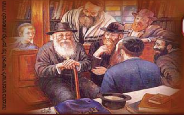
תורה למשפחה קליטת על ואשיר לשריגמש בתמונה