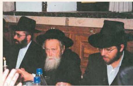
הגה"צ המשפיע הרב משה ובר זיע"א

העדה החרדית עצרת בהשתתפות אלפי ילדי תשב"ר מירושלים ומרחבי הארץ. כ"ק האדמו"ר מליובאוויטש שיגר לחסידיו שבארץ ישראל בקשה מיוחדת: לדאוג לכך שבמהלך העצרת, שנערכה ברחבת מאה שערים, יאמרו שנים עשר הפסוקים שאותם בחר לחזרה ושינון עבור ילדי ישראל. הרבי הסביר, כי בכך שעוללים ויונקים ישמיעו את הפסוקים הללו מתוך טהרת הלב, יביא הדבר "להשבית אויב ומתנקם". הבקשה היתה יוצאת דופן, אולם עז היה רצונם של חסידי חב"ד להוציא לפועל את בקשת הרבי.