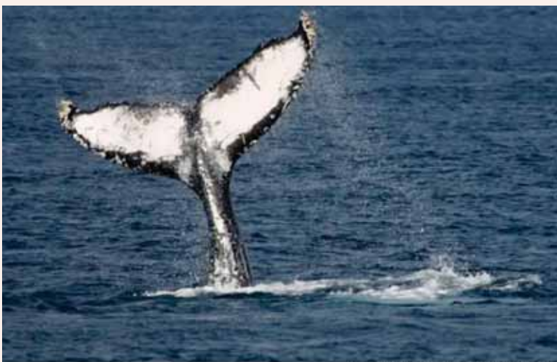
חופי אוקינאווה שבִּיפן

המעבורת, מומחים אומרים שסדק כמו זה שנפער בה מלמד כי ייתכן מאוד שהיא התנגשה בלווייתן.