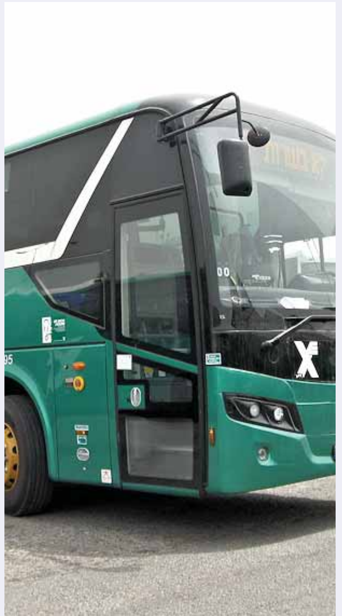
מאת: ישראל לביא

חשש למחטף בחירות של שר התחבורה ♦ ניזון 11 חושף כי השר ישראל כ"ץ מאשר לראשונה חילול שבת ציבורי של אגד