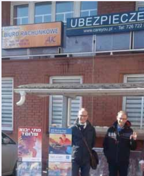
מאת: ישראל לביא

חרדים שנמצאים בליז'ענסק שבפולין לרגל יום ההילולא נדהמו לגלות פעילות מיסיונרית ממוקדת לבאי ההילולא