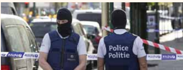
מאת: ישראל לביא

אנטוורפן - פשע שנאה בלב הקהילה החרדית באנטוורפן בלגיה ♦ מצב האשה קל