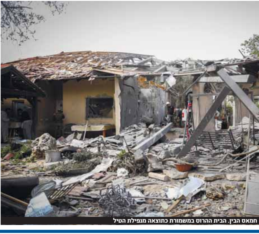
חמאס הבין. הבית הרוס במשמורת כתוצאה מנפילת הטיל