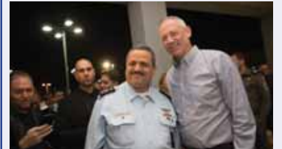
מאת: יוני שטיין

יו"ר התנועה דרש לחקור את המפכ"ל לשעבר וגורמים נוספים בעקבות ממצאי מבקר המדינה בעניין הקשר בין מחלקת הרכש במשטרה לבין החברה בראשות יו"ר כחול-לבן ♦ "במסגרת החקירה יש לבדוק האם אנשים שאינם אנשי מערכת הביטחון נחשפו למידע ביטחוני חסוי"