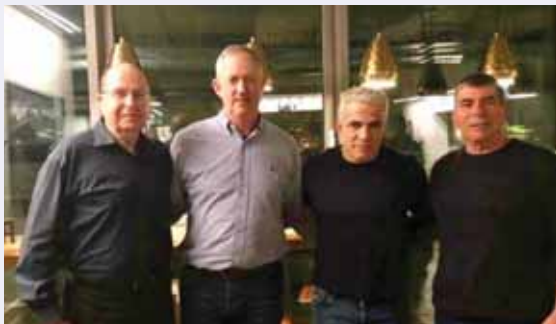
מאת: יוני שטיין

יו"ר כחול לבן הוקלט מלכלך על חבריו להנהגה בישיבה עם קומץ פעילים ומסביר כי אינו סומך עליהם, ובין היתר לא שולל ישיבה עם נתניהו בממשלת אחדות