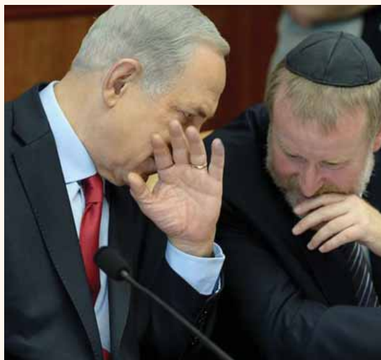
מאת: יוני שטיין

בנט: "ביטול הקבינט הביטחוני הוא הפקרת תושבי הדרום בשביל פוליטיקה, תושבי הדרום לא יכולים להיות בני ערובה של קמפיין בחירות"