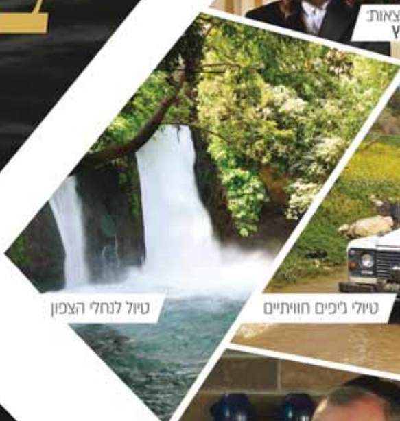
טיול לנחלי הצפון