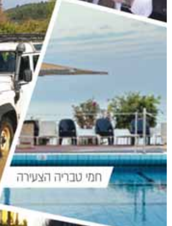
חמי טבריה הצעירה