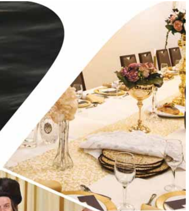
הזמר והחזן: מאיר גפני

112 חדרים • סוויטות פרמיום • אולמות אירועים • חדר כושר • בריכה • ספא רח' זיידל 9 עבירה | res@kinorothotel.co.il | kinorothotel.co.il