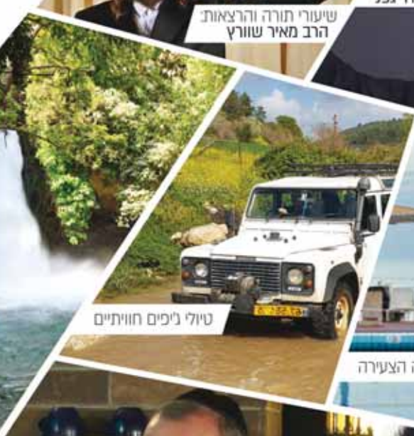
טיולי ניפים חווייתיים