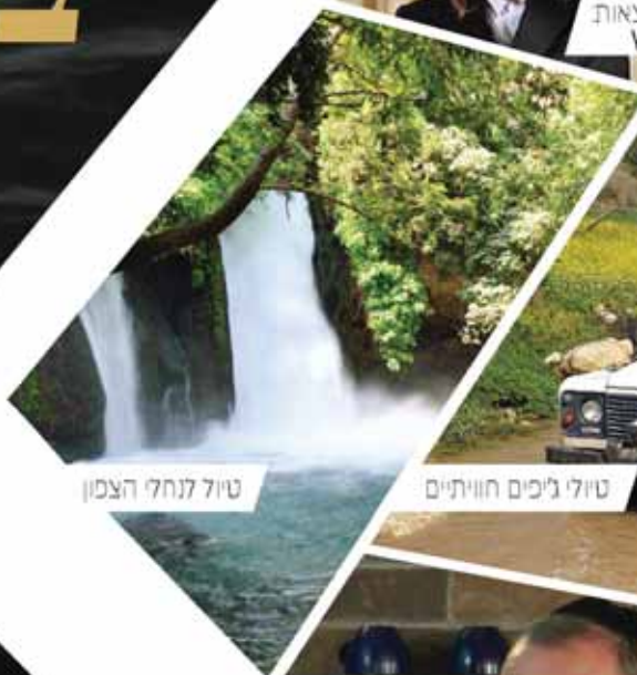
טיול לנחלי הצפון