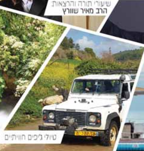
טיולי ג'יפים חוויתיים