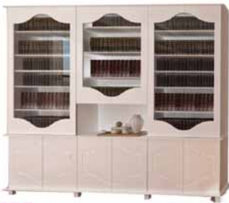
ספרירת המלך דוד 2.40 מ' סנדוויץ גוון אפוקסי, גוונים לבחירה רק 5.990 ₪ 8.800 ₪

מבצע חתן וכלה רק 9,999 ₪ מחירים מסונכדים ע"י קרן חתנים