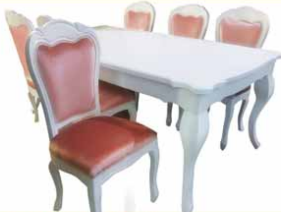
שולחן לואי + 6 כסאות עץ מלא רק 11.990 ₪ 18.000 ₪