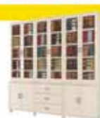
ספרית קודש סנדוויץ 2.40 מ' רק 3.700 ₪