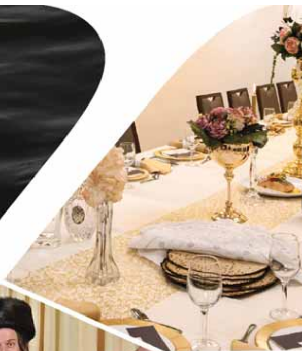
הזמר והחזן מאיר גפני

רח' זיידל 9 ענבה | res@kinorothotel.co.il | kinorothotel.co.il