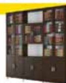
ספרית קודש סנדוויץ 6 דלתות 2.40 מ' רק 2.800 ₪