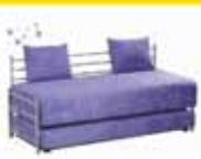
מיטה עלקל מרזונים אורטופדיים רק 1.490 ₪