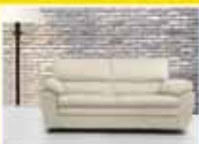
סלון מעוצב איכותי 3+2 רק 2.800 ₪