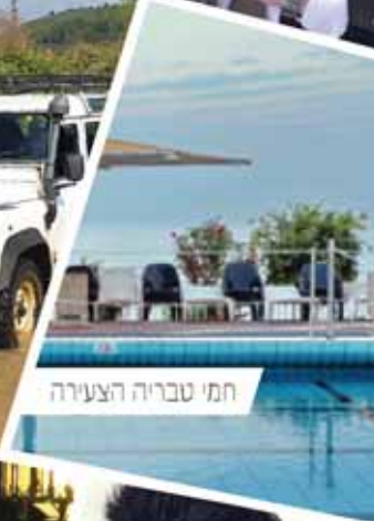
חמי טבריה הצעירה