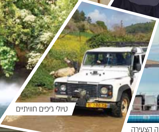
טיולי ג'יפים חוויתיים