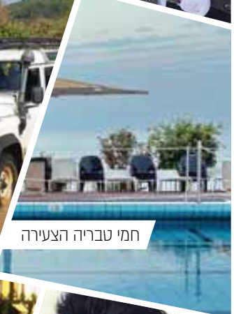
חמי טבריה הצעירה