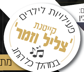
אומן הקלדים: יענקי רובין