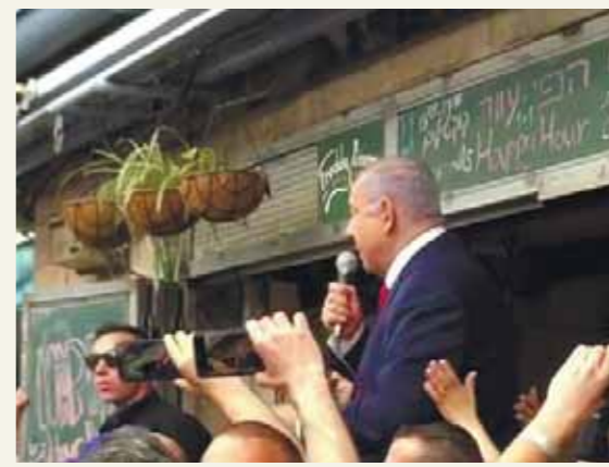
מאת מאיר ברגר

ראש הממשלה נשא דברים בפני סוחרי השוק והקונים והמריץ את תומכי הליכוד לצאת מהבית להצביע