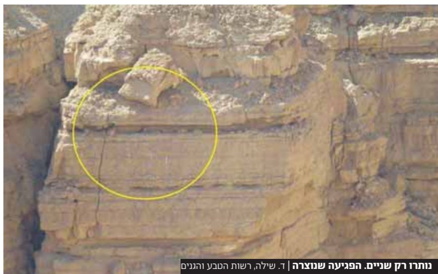
נותרו רק שניים הפגיעה שנוצרה ד.ד. שילה. רשוח הטבע והגנים