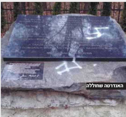
מאת א. לחל

באוטבוצק שבמרכז פולין רוסטו שני צלבי קרס על אנדרת טה לזכר קדושי העיר שנרצחו בשואה ונקברו במקום, שניצבת בסמוך לבית הקברות בעיר. האנדרטה, לוח אבן עם כיתר בים בעברית ופולנית, הוצבה לזכרם של אלפים יהודים שהוצאו להורג במהלך השואה בעיר. לאחר שחוקרי המשטרה הגיעו למקום ותיעדו את הונדלית, הגיע למקום איש דת קתולי, וחדר עם שניים מעובדי בית הקברות המקומי ינקו את צלבי הקרס מעל האנדרטה. האנדרטה המקורית לזכר יהודי אוטבוצק שרצחו בשואה הוצבה בסמוך לבית הקברות המקומי בשנת תש"ט, ובשנת תשע"ב היא הוחלפה באנדרטה חדשה שנוצרה במקום על ידי הוועד להצלת יהודי אוטבוצק. על האבן מונח שלט: "כאן,