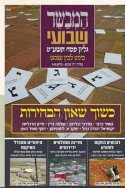
שבועי 2 חלקים