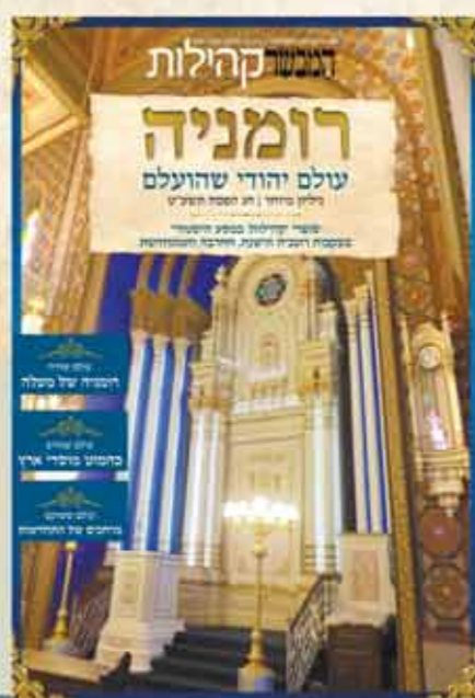
קהילות במהדרת חג

בואו לגלות מה צפון בגיליונות "המבשר" לפסח