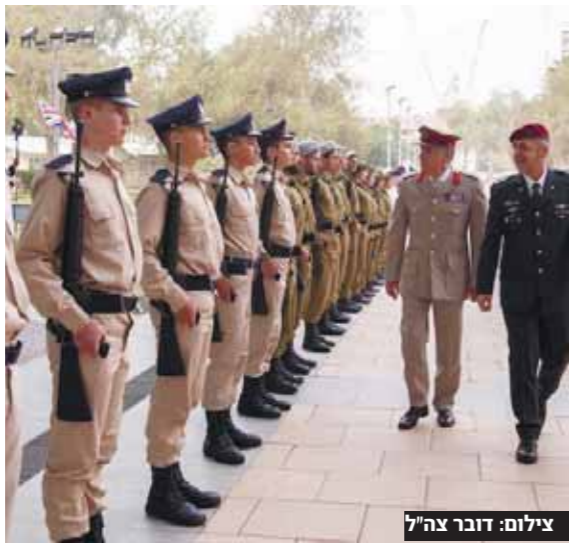
מאת סופרנו הצבאי

קרטו התקבל במשמור כבוד בקריה ם בצה"ל מציינים כי ביקור רמטכ"ל בריטניה בארץ מודגיש את השותפות המתפתחת בין צה"ל לצבא הבריטי