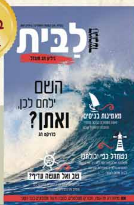
לבית במהדורה מיוחדת