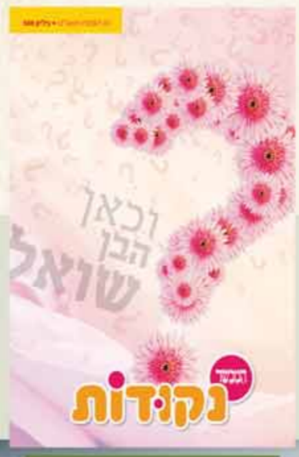
נקודות מורחב לילדים