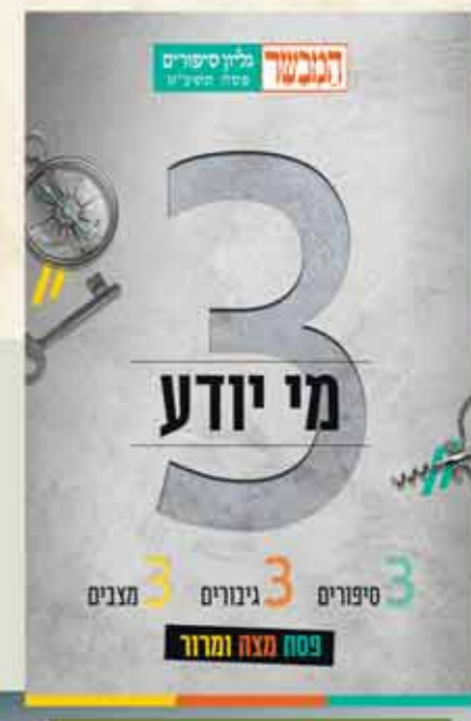
גיליון סיפורים ייחודי