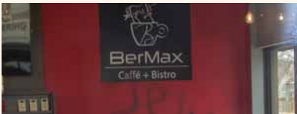
מאת: ישראל לביא

המשטרה חוקרת את האירוע כפשע שנאה יחד עם ניסיון שוד שלא צלח