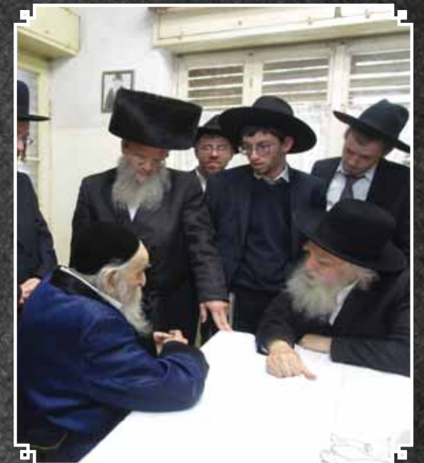
האדמו"ר מטאלנא בשאיבת מים שלנו