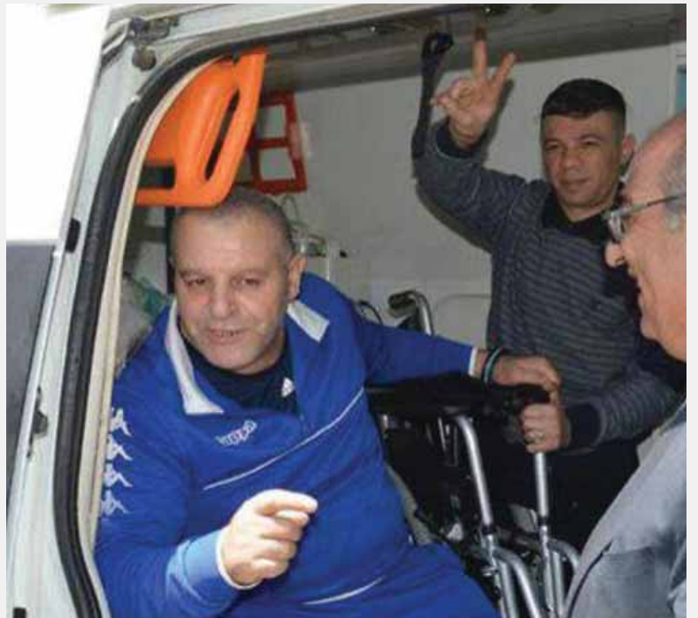
מאת: מ. יוד

הסורים הועברו לסוריה דרך מעבר קוניטרה • שרים: "לא היה צורך באישור הממשלה"