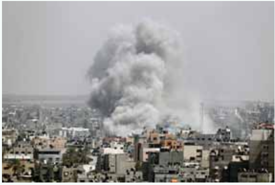
מאת: מ. יוד

מאת: מ. יוד הערוץ האמריקני "אל-חורה" בשפה הערבית דיווח שלשום מפי מקורות ישראלים שוחחו עמו כי "שיקולים הקשורים לאיראן גרמו להפסקת הסבב האחרון ברצועת עזה". המקורות אמרו לערוץ כי "לא ניתן לחשוף את השיקולים בשלב זה".