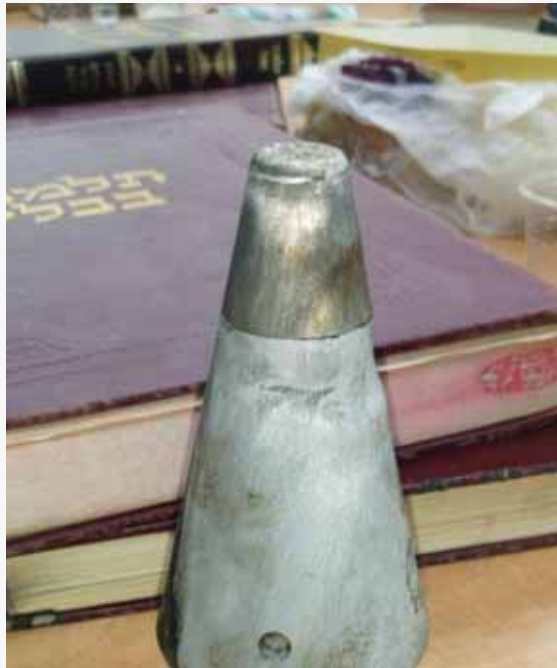
להגעת כוחות הביטחון ומשטרת ישראל.

מנגנון הפעלה של רקטה, ששוגרה מעזה ויורטה ככל הנראה בסבב הלחימה האחרון בדרום, אותר בסוף השבוע שעבר על ידי ילד במרכז העיר שדרות. הילד הביא את החפץ החשוד לרב בבית חב"ד המקומי, וזה הזעיק את כוחות הביטחון.