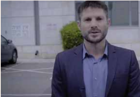
מאת: ישראל לביא

המלחמה על סמל ההתיישבות עולה מדרגה ♦ לראשונה חגיגות בתחנת הרכבת סבסטיה. דגן: "אנחנו בעלי הבית, ואנחנו נהיה כאן לתמיד"