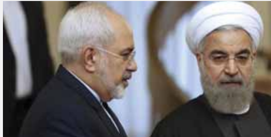
מאת: ישראל לביא

האפגנים הם הפועלים השחורים של איראן ועושים את העבודות הכי פחות רצויות באיראן תמורת פרוטות ♦ המטרה האיראנית היא להפעיל לחץ מגל מיליוני פליטים שיכולה ליצור כאוס כלכלי