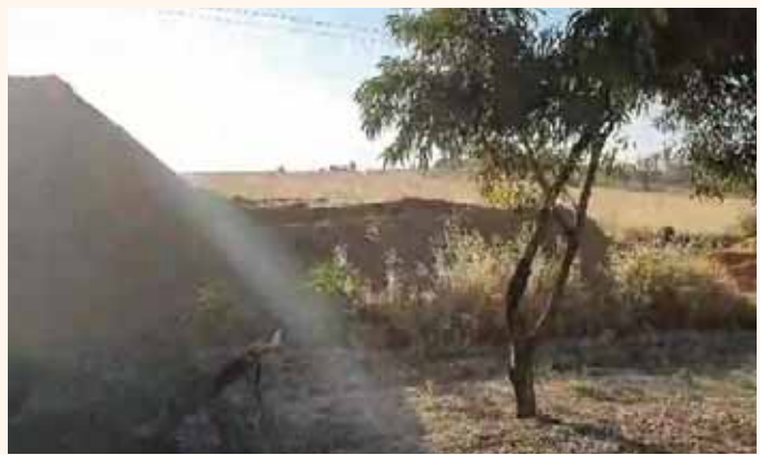
מאת: מ. יוד

הוקמה סוללת עפר לאורך כביש בצפון העוטף ובימים הקרובים תוקם סוללה נוספת • אזורים נוספים בגבול הרצועה הוסתרו על ידי קירות בטון