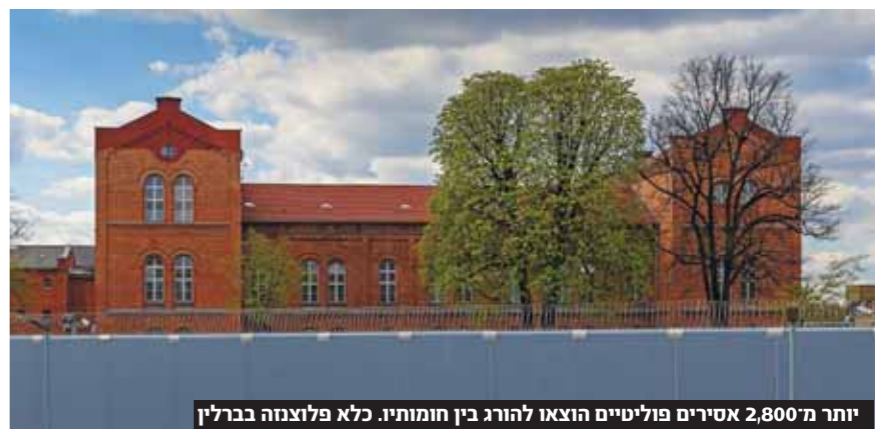
יותר מ-2,800 אסירים פוליטיים הוצאו להורג בין חומותיו. כלא פלוצנה בברלין

השרידים התגלו לפני ארבע שנים במעבדה של הרמן שטיבה, שהיה פרופסור לאנטומיה בימי השואה וניצח על ניסויים מזוויעים בחללים שהוצאו להורג בין חומות הכלא