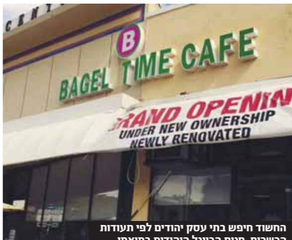
החשוד חיפש בתי עסק יהודים לפי תעודות הכשרות. חתם הביגל היהודי במיאמי

תושב מיאמי נעצר בחשד שהתקשר לבתי עסק של יהודים, השמיע דברי אנטישמיות ואיים לפגוע בבעלי העסקים. התלונה האחרונה למשטרה הגיעה בשבוע שעבר לאחר שהאיש, מתיא רוצ'צ'יק, התקשר למסעדת בייגלים בבעלות משפחה יהודית ואיים על הבעלים. האיש אמר לבעלים בטלפון: 'אחשוק את כולכם' - לא לפני בשיחה אחרת הוא טען כי היהודים משייכים את העולם והודיע: 'אנחנו