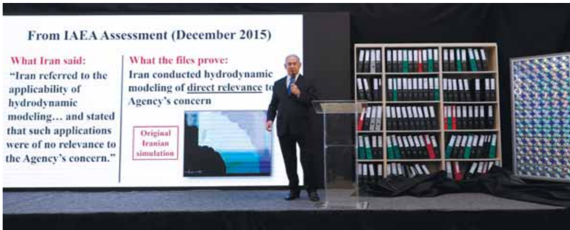
מאת סופרנו הצבאי

הפרס המוענק מדי שנה ליחידים או לגופים עבור פעילות שתורמה להגברת הבטחון של מדינת ישראל, יגיע הפעם לסוכנים שביצעו את הפעולה שההיממה את העולם