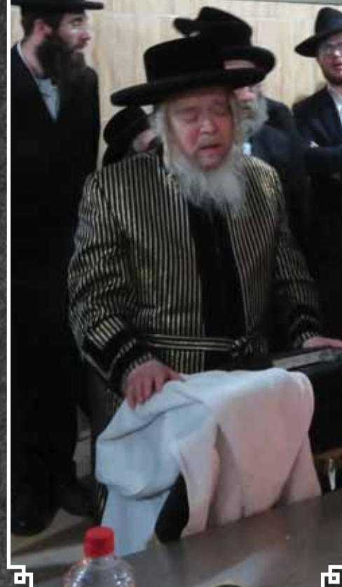
גאב"ד קארלסבורג במירון