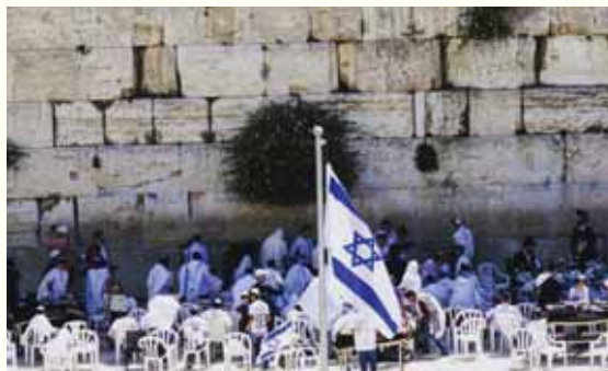
חמאת: ישראל לביא

אף מדינה אחרת מעולם לא הייתה בעלת הריבונות החוקית בעיר, ולכן השתלטות ישראל על השטח ב-67 לא הפכה אותו ל"שטח כבוש"