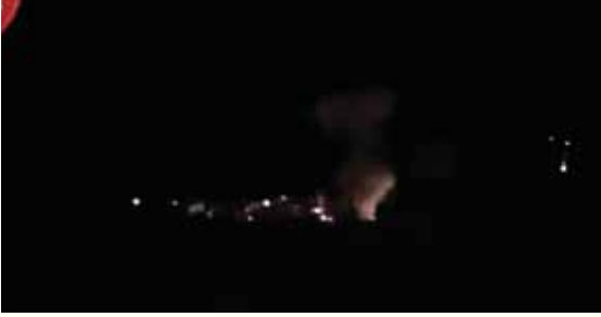
מאת: ישראל לביא

הרוג ושני חיילים פצועים • מחסן תחמושת נפגע ונגרמו נזקים למבנים ולציוד במקום