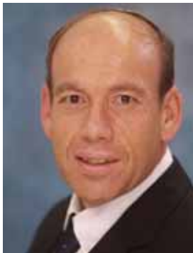
חמאת: ח. פרינקל

רכאות הסבירה כי המפכ"ל וכי דומה מתמנים על ידי הממשלה, ואז קיימת בעיה שהממשלה לא זכתה באימוץ הכנסת ובנוסף קיים חשש מבחירה משיקולי בחירות, מבקר המדינה לעומת זאת, מת מנה ע"י חברי הכנסת בהצבעה חשאית ולכן אין חשש מבחירה מוטית בחירות.