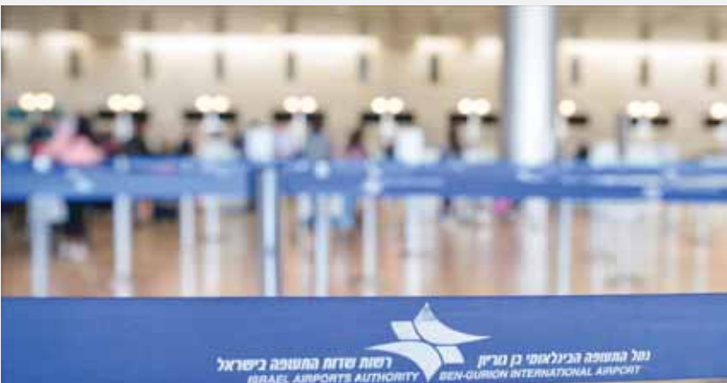
נמל התעופה הבינלאומי בן גוריון | רשות שדות התעופה בישראל | ISRAEL AIRPORTS AUTHORITY | BEN-GURION INTERNATIONAL AIRPORT

מאת: מ. יוד שישה חשודים נעצרו אתמול לחקירה באזהרה ועוד שמונה עוכבו בחשד שהשתייכו לרשת שעסקה בהברחת זרים דרך נמל התעופה בן גוריון (נתב"ג) למדינת ישראל. הם חשודים בעבירות של שוחד, מרמה והפרת אמונים, קשירת קשר לפשע וקבלת דבר במרמה. על פי החשד, המעורבים פעלו במשך תקופה ארוכה במי