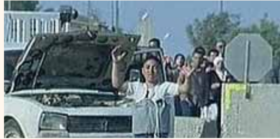
מזוהים עם ארגוני טרור כדוגמת דאע"ש וג'בהת אנוסרה.