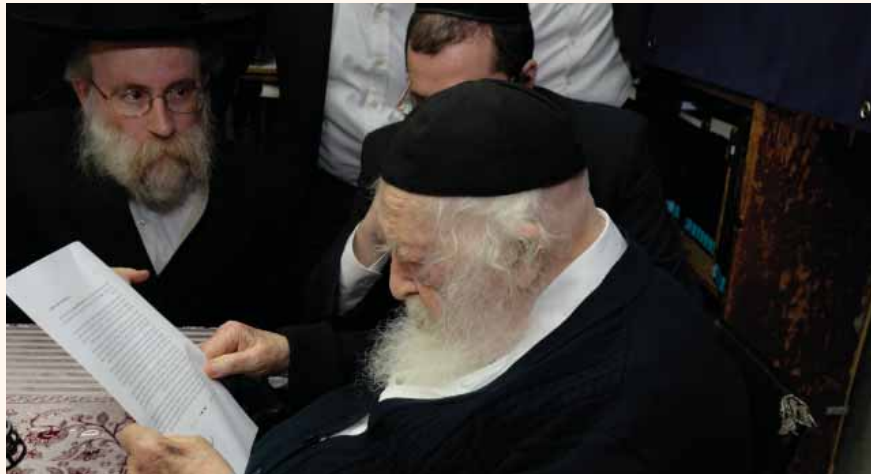
אותנו, ורק את הדבר הזה שיקל להציל את שנים היפות ביותר שלנו, לא לימדו אותנו". וזו הסיבה שהארגון משקיע מאמצים ומשאבים אדירים בהכשרה של הזוג הצעירים. "במקום לבנות בית חולים מתחת לגשר, גות הצעירים."

קהלים רחבים מביעים עניין רב במגבית שבמרי כזה הקריאה לתת לכל משפחה את "הזכות להצליח". מדובר ללא ספק בתרומה החכמה ביותר שמכפילה את עצמה בכפל מונים. "לפי התחשיבים שלנו" אומרים מנהלי הארגון, "כל שקל שיתרם במגבית, שווה למשפחות חיסכון של לפחות 13 שקלים". ומוזכרים את דבריו המפורסמים של הרמב"ם ש"זו הצדקה המי עולה שבצדקות".