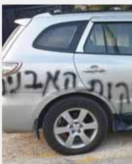
השנה נרשמו 12 אירועים.

סכו כתובות נאצה בכפר עינבוס שבשומרון. הכתובות, בהן נכתב "פינוי יצהר תג מחיר" ו"ד"ש מהבלאד", רוססו על המסגד במקום, בתים פרטיים והמרפאה המקומית. בתים פרטיים והמרפאה המקומית. צמיגיהם של ארבעה כלי רכב נוקבו ועל אחד מהם רוסס מגן דוד.