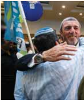
פעולות מאוד מבורכות. הוא גם עזב אותה בנקודה לא פשוטה בדרך אבל פנינו קדימה, אדם ניוון על פי רובו ואנחנו בהחלט מתכוונים למצוא את הדרכים לחבר את כל הימין ביחד, פרץ הגיב למינויים שלו