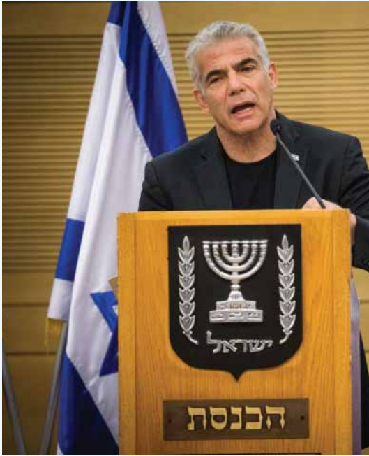
מאת: ח. פרנקל

על האמירה ביום שישי: אני נגד מדינת כל אורחיה, דבברי הוצאו מהקשרם • על יעלון: הניסיונות לפרק אותנו לא יצליחו