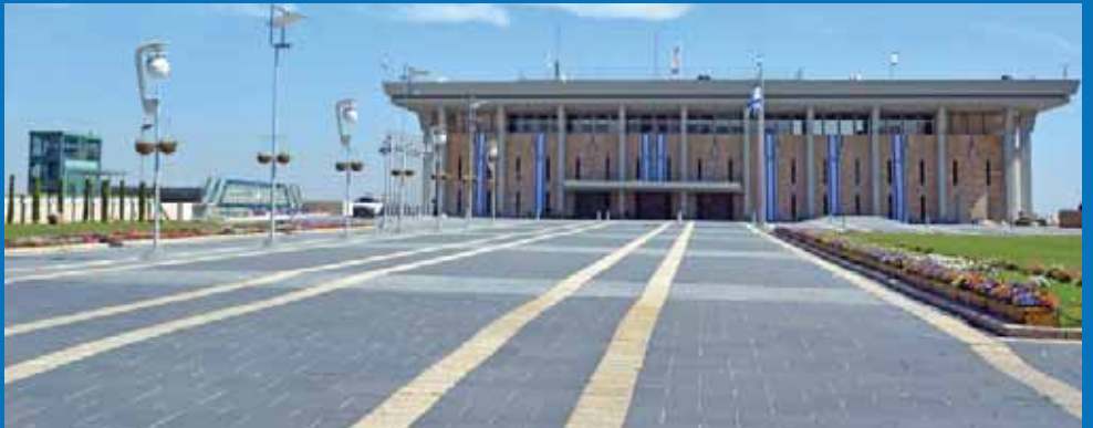
ע"פ התוכנית, 80 ח"כים יחתמו על ביטול הבחירות, ותוקם ממשלת אחדות

סוכלה פריצת דרך בשמורת טבע בשטח B במדבר יהודה