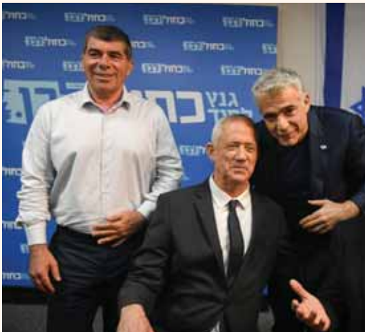
מאת: ת. פרנקל

ע"פ התוכנית, 80 ח"כים יחתמו על ביטול הבחירות, ותוקם ממשלת אחדות