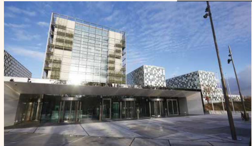
מאת: מ. יוד

לפתוח בחקירה פלילית נגד יו"ר הרשות, מחמוד עבאס (אבו מאזן), בגין פשעים, שביצע נגד בני עמו, הכוללים מסע שיטתי ונרחב של רצח, עינויים ומאסרים בלתי חוקיים נגד האוכלוסייה הפלסטינית. העדויות, שתוגשנה מחר, מצביעות על מנגנון שיטתי ומשומן, המדכא בכלים אלימים את האוכלוסייה האזרחית".