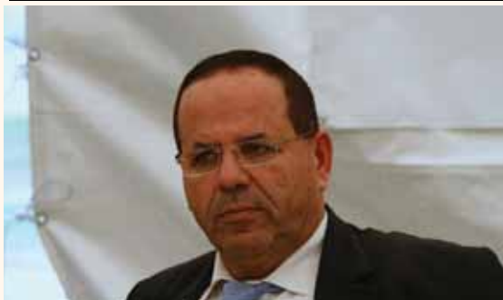
מאת: ח. פרנקל

לאחר ההתנגדות הרבה, השר איוב קרא מוותר על התפקיד • מאשים: פעם האמנתי לנתניהו, היום לא