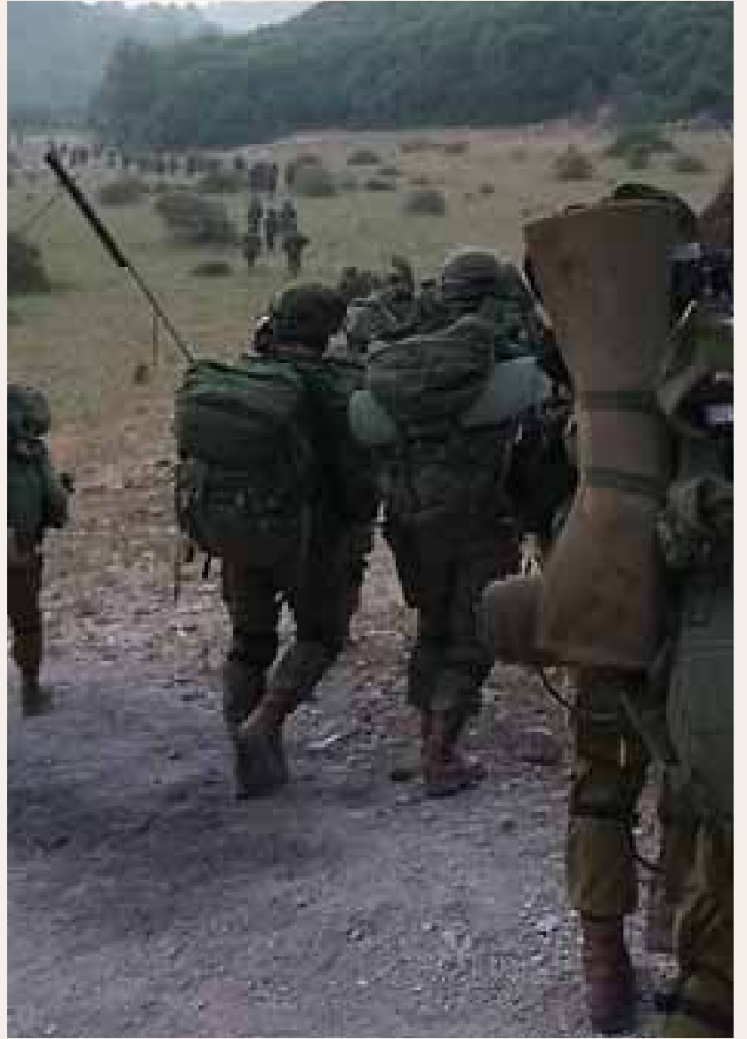
מאת: מ. יוד

עשרות רחפנים להטלת חימושים, מאות לוחמים שיחדרו לשטח האויב בחשאיות ומפקדי צוותים שיכוונו מטוסי קרב - מול חשש הדרג המדיני מהפעלת כוחות היבשה • כתב "ynet" תיעד את חטיבת הקומנדו בתרגיל מלחמה