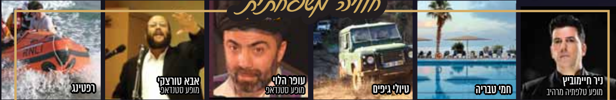
טיולי ג'יפים, מופע קליקאים, חמי עבריה ועוד ים של טיולים ואטרקציות...