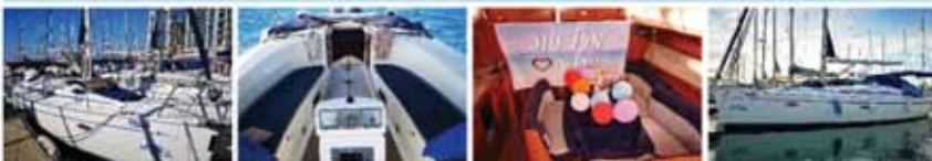
הפלגות פרטיות על יאכטה ספונות למסעות ושלט סול טוב קישוט בלונים, פינת שכיבה ספונות בצל מלא פינת שכיבה ספונות בשמש

מתאים במיוחד לזוגות, ימי הולדת, ימי נישואים, פגישות מתקדמות