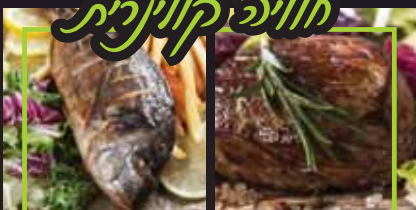
ארוחת גורמה עם השף מאיר איפרגן