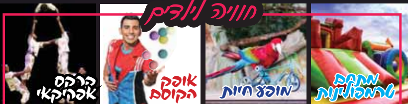
קייטנת 'צליל וזמר' בכל יום, ועוד ים של הפעלות והצגות