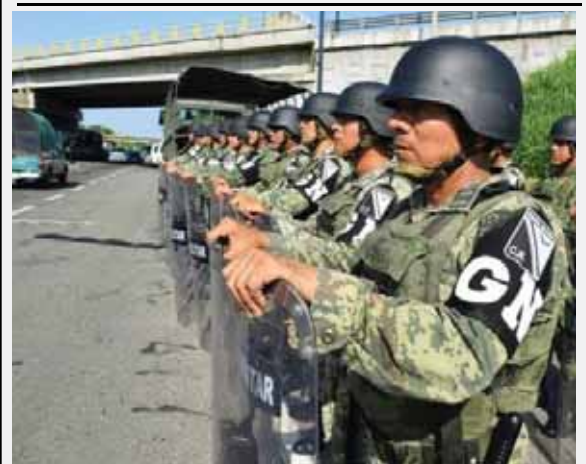
מאת אברהם יוסמן

ההתגייסות של מקסיקו למהלך נעשתה לאחר שארה"ב איימה להטיל סנקציות על מקסיקו