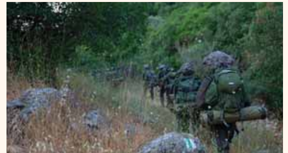
מאת: ת. יוד

במהלך התרגיל הוקפץ כוח לפעילות מבצעית באזור סמוך, אך המתרגלים לא ידעו עליו וירו לעברו. לא היו נפגעים ♦ דובר צה"ל: האירוע תוחקר