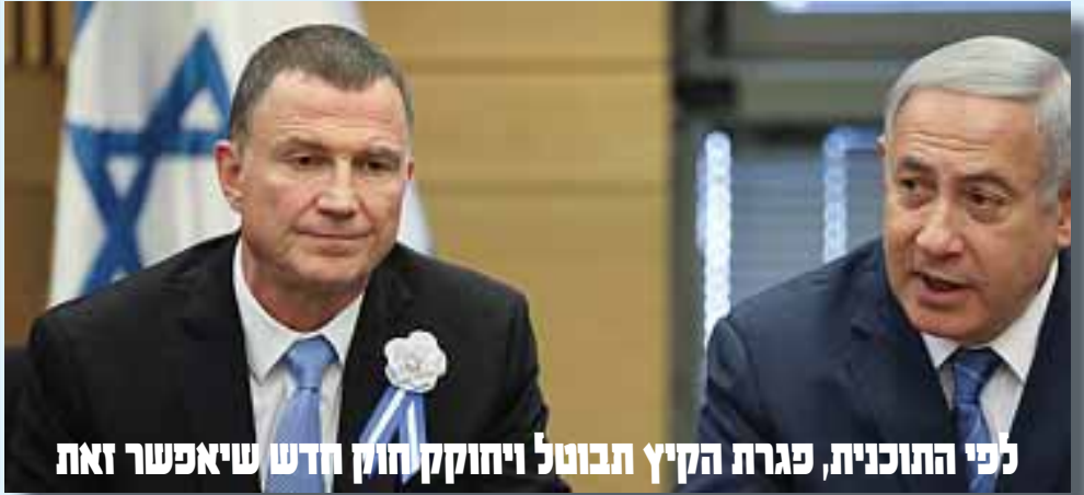
לפי התוכנית, פגרת הקיץ תבוטל ויחוקק חוק חדש שיאפשר זאת

היועמ"ש: אין אפשרות חוקית לדחות את הבחירות