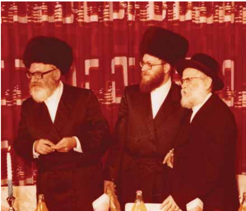
צק בדרשות שיעקר כונתן חלק המוסר וכיון שמילתא