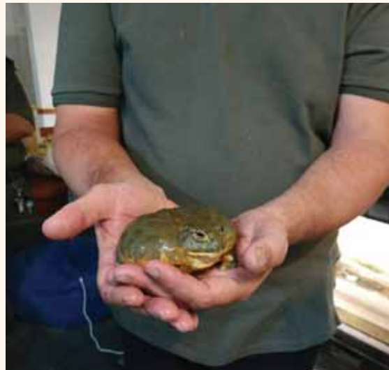
מאת פ. יוחנן

רשות הטבע והגנים ומשמר הגבול שיתפו פעולה במבצע למאבק בסחר בלתי חוקי בבעלי חיים • במסגרת הפעילות נתפסו 4,400 פרטים נדירים ברחבי העולם