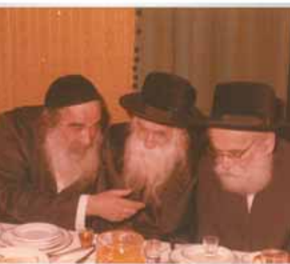
דתמיהא מיכר דכירי מתבל זאת בפירוש פסוק וכו' אולם הלוקח רק חלק השנינות שבו דומה לחולה שצ' ריך לרפואתו תרופה מרה ולכן ערבם הרופא עם דבר מתוק, ולקח החולה רק את המתוק לחיך.

סיפורי צדיקים מצא לו היצה"ר עצה שבדה סיפורים שאינם אמיתיים, אף שנראה שהם מלמדים תויר"ש מ"מ מאחר והוא שקר אין יוצא מזה טוב.