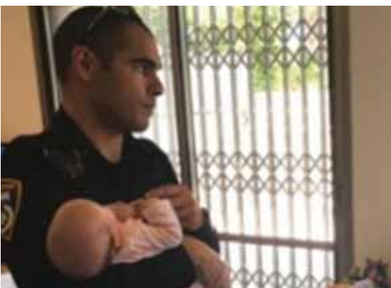
לפציעת התינוקת וחילץ אותה בריאה ושלמה.

מאת: ישראל לביא למוקד 100 התקבל דיווח מתושבת בנימינה, שדיווחה כי ביתה התינוקת שלה בת החודשיים ננעלה ברכב בישוב בנימינה, כאשר מפתחות הרכב נותרו בפנים, ללא יכולת פתיחה מבחוץ. ניידת משטרה שסיירה באזור הוזעקה למקום והגיעה תוך פרק זמן קצר כדי לסייע בהצלת חייה של הפעוטה. כאשר עם זיהוי הרכב, שבר השוטר את החלון הצדדי של הרכב, באופן שלא יגרם