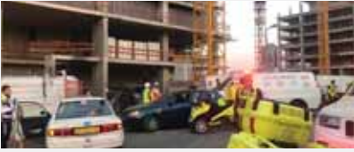
רקורד בטיחות עגום שצבר"

פרסום ראשון: חברת הבנייה מחאמיד תאופיק הושעתה ♦ זאת לאחר שהוצאו נגדה שני צווי בטיחות ובעקבות מספר תאונות קטלניות שאירעו באתרי בנייה שלה וגבו חיי אדם