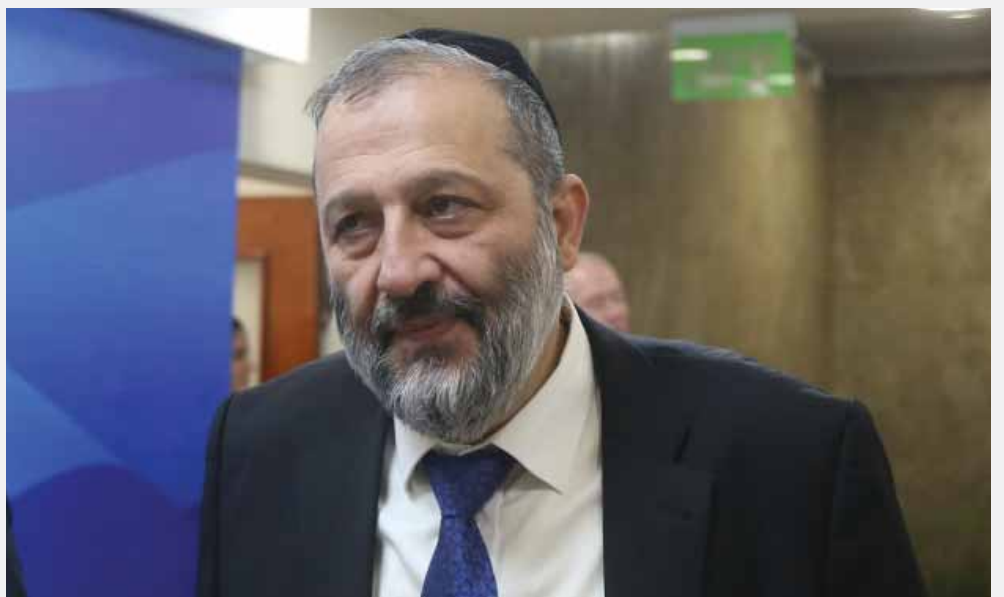
מאת: ח. פרנקל

דרעי התייחס לזיומת יו"ר הכנסת וטוען: אין לזה סיכוי מבחינה משפטית ♦ על חזרתה של ברק לפוליטיקה: לא יעביר מנדטים מגוש לגוש