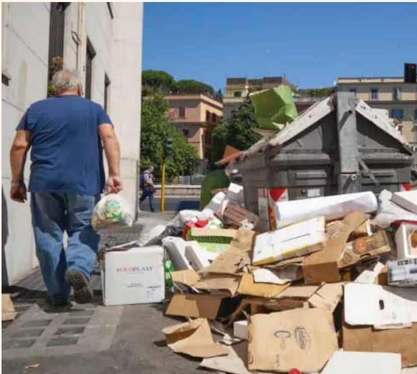
מאת פ. יוחנן

משבר האשפה בבירת איטליה הולך ומחריף, ורופאים מזהירים מהסכנות הבריאותיות הטמונות בכך • המצב החמיר תחת ראש העיר הנוכחית, והתושבים זועמים