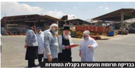
בבדיקת תרומות ומעשרות בקבלת הסחורות

במהלך הסיור עמדו חברי הבר"ץ מקרוב אחר סודי ההשגחה הקפדניים במפעל המייצר בימים אלה במשמרות בכל שעות היממה