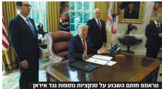
טראמפ חותם השבוע על סנקציות נוספות נגד איראן

רוחאני: "הסנקציות האחרונות מחקו כל אפשרות למו"מ" ■ איראן מאיימת לסגת מחלקים נוספים בהסכם הגרעין