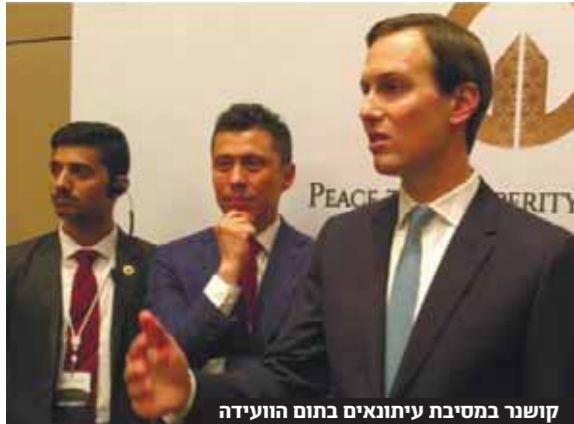
קושנר במסיבת עיתונאים בתום הוועידה

בתום 'הסדנה הכלכלית' שיום הבית הלבן הגיב יועצו בכיר של טראמפ לביקורות, ואמר שהתרחש מהישיגי הוועידה. "אנשים לא ידעו למה לצפות. הם עוזבים חדורי אנרגיה והתלהבות" ■ קושנר: "איך לנו כוונה להעניש את הפלסטינים על החרם, אנחנו לא בענייני אגף" ■ שר האוצר הסעודי: "נתמוך בכל דבר שיביא שגשוג לאזור"