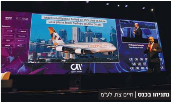
נתניהו בכנס

ראש הממשלה דיבר בכנס הסייבר על פעולותיה הבינלאומיות של ישראל בתחום, שמסייעות לבטחונן של מדינות רבות