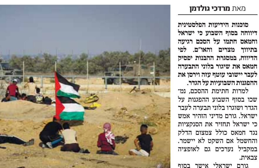
לפי פרטי ההסכם, שנחתם התחייב להפסיק את הפרחת בלוני התבערה לעבר ישראל על הגדר. מנגד, ישראל החלה

לאפשר הכנסת סולר לתחנת הכוח בעזה דרך מעבר כרם שלום והגדילה את מרחב הדיג ל-15 מייל ימי. בנוסף ישראל התחייבה לפי הדיווח להשיב לרצועת עזה 60 סירות דיג עותיות שהוחזרו על ידי צה"ל. גם אחרי פרסום דבר ההסכם, אותרו צורר בלוני התבערה במהלך יום ששי בשדה קהלא במועצה האזורית אשכול. לא היו נפגעים. מוקדם יותר נחת צורר בלונים עם ספר ממולכד בתוך קיבוץ באשכול. חבלני המשרדה הועקו לשני המוקדים. הספר הממולכד היה עם כיתוב בעברית במטרה להשיב את הבלונים במטרה למשוך אליו לידים או סקרנים במועצה האזורית אשכול הבהירו בעקבות הספר הממולכד: "חשוב ביותר – בכל מקרה של זיהוי פריט חשוד כלשהו גם אם לא מחובר לבלונים, אין לגעת, יש להתרחק ולדווח לרובש"ף שיושב